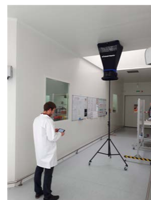
Utilisation avec le trépied télescopique