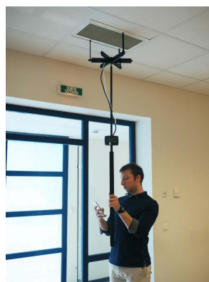
Utilisation avec la grille de mesure