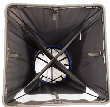
Hotte avec redresseur de flux