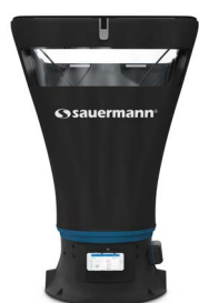
Boîtier du DBM 620 sur la base

Le boîtier du DBM 620 communique via connexion sans fil avec votre smartphone ou tablette, ce qui permet de lire et d'exploiter les valeurs mesurées directement sur l'écran de votre appareil, via l'application mobile dédiée SmartKap.