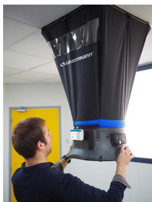
Mise en situation du débitmètre